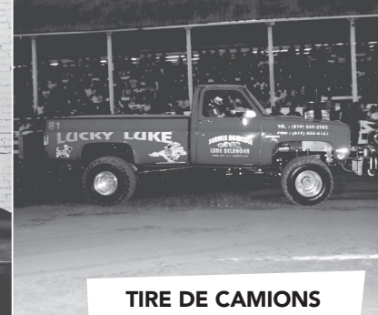
TIRE DE CAMIONS Dimanche 18 h 30 | Sunday 6:30PM

La barrière ouvre à 12 h jeudi le 22 août