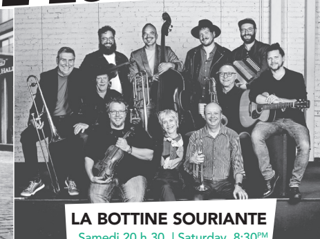
LA BOTTINE SOURIANTE Samedi 20 h 30 | Saturday 8:30PM