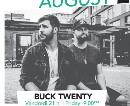
BUCK TWENTY Vendredi 21 h | Friday 9:00PM